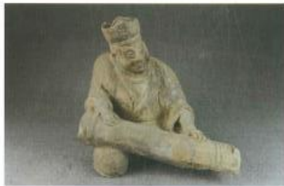
■ 图1 抚琴俑

黔西南居于贵州西南部，与滇、桂相接，历史上曾为夜郎的重要组成部分。夜郎是战国至秦汉时期中国西南地区的一个古国，存在时间大约300年。西汉武帝时期，归附汉朝，“其地分隶犍为郡和群柯”。 〔1〕